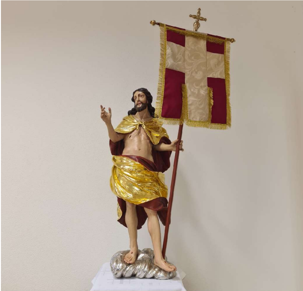
Bild: Der frisch restaurierte Auferstandene

Ostarrichi Pfarre - Millenniumsplatz 2 - 3364 Neuhofen/Ybbs - www.pfarre-neuhofen.at - pfarre.neuhofen@gmx.at - Tel. 07475-52119