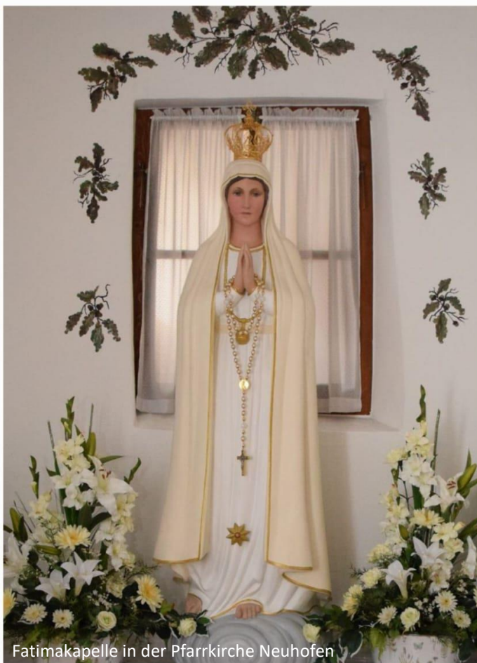
Fatimakapelle in der Pfarrkirche Neuhofen

Ostarrichi Pfarre - Millenniumsplatz 2 - 3364 Neuhofen/Ybbs - www.pfarre-neuhofen.at - pfarre.neuhofen@gmx.at - Tel. 07475-52119